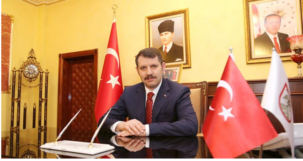
Salih AYHAN Sivas Valisi